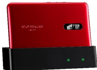
クレードルセット