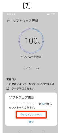
[今すぐインストール] ]をタップします。