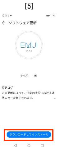
[ダウンロードして インストール] タップします。