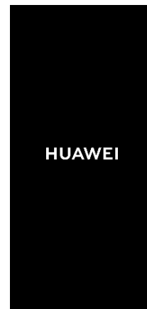
アップデートが開始され、 再起動後に更新が完了します